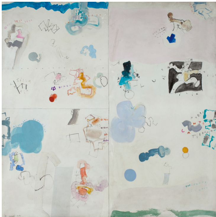
JARDINERO REGANDO. (1969). HERNÁNDEZ MOMPÓ

En este programa el alumnado podrá trabajar en la mejora de la atención. Para ello se trabaja la mirada profunda sobre obras de arte, para trasladarla posteriormente a objetos reales. Además se realizará una actividad de relajación de cuerpo y mente para posibilitar el control sobre la atención. Por último el alumnado podrá realizar una actividad creativa sobre su experiencia en el Museo.