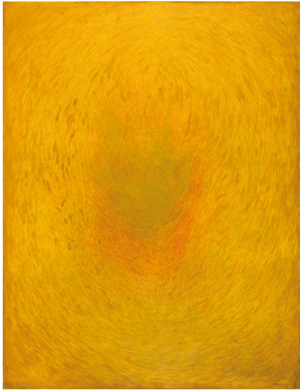
PINTURA. [1967]. - JAIME BURGUILLOS

Este programa está preparado para realizarse en las escuelas infantiles. Los recursos educativos incluyen cuentos, reproducciones de obras artísticas, una caja de descubrimiento y un kit musical para poder acercarse de una manera lúdica al arte contemporáneo.