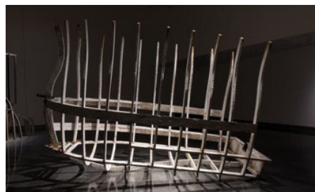
NO RETORNO. (2017). - CECILIA PAREDES