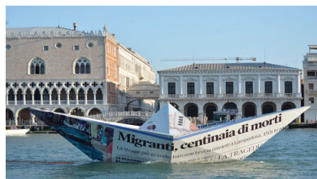
LAMPEDUSA. (2015). - VIK MUNIZ

A través de las obras de los artistas Cecilia Paredes y Vik Muniz, el alumnado realizará un recorrido sobre algunas historias de migración. Así podrá pensar sobre las dificultades que conlleva el concepto de "viaje vital". El conocimiento de esta realidad, la empatía hacia las personas migrantes y la visión de un mundo complejo, global y multicultural serán algunos de los aspectos a trabajar. Para ello se realizará una actividad creativa en el que el alumnado pueda crear su propia historia del viaje migrante.