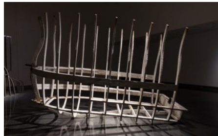
NO RETORNO. (2017). CECILIA PAREDES