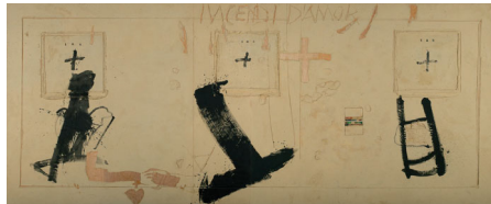
INCENDI. (1991). ANTONI TÀPIES

¿Por qué somos diferentes? ¿En qué somos iguales? ¿Qué ventajas tiene la diversidad y la diferencia? En este programa se trabaja la aceptación de las diferencias y la inclusión de todas las personas utilizando el reconocimiento y la gestión emocional. Además, se trata de avanzar con el alumnado en cuestiones relacionadas con la perspectiva de género. Se fomentará la inteligencia creativa focalizada en los colores de la diferencia mediante la realización de diferentes actividades plásticas. El alumnado intervendrá obras de Cecilia Paredes y Antoni Tàpies, aportando en ellos su creatividad.