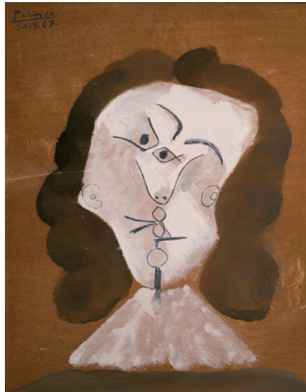
MOUSQUETAIRE TÊTE. [1967]. - PABLO PICASSO

En este programa se proponen varias actividades artísticas que ayudan a desarrollar la observación, la creatividad, el mundo emocional, la iniciativa personal y las habilidades comunicativas, incluida la lengua inglesa, y la socialización, entre otros aspectos. Así, se pueden adquirir competencias como la artística o el aprender a pensar. Todo el programa educativo se articula a través de un cuento que sirve de hilo conductor para las diferentes actividades de canción gestual, expresión corporal y creatividad plástica.