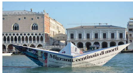
LAMPEDUSA. (2015). VIK MUNIZ

A través de las obras de los artistas Cecilia Paredes y Vik Muniz, el alumnado realizará un recorrido sobre algunas historias de migración. Así podrá pensar sobre las dificultades que conlleva el concepto de "viaje vital". El conocimiento de esta realidad, la empatía hacia las personas migrantes y la visión de un mundo complejo, global y multicultural serán algunos de los aspectos a trabajar. Para ello se realizará una actividad creativa en el que el alumnado pueda crear su propia historia del viaje migrante.