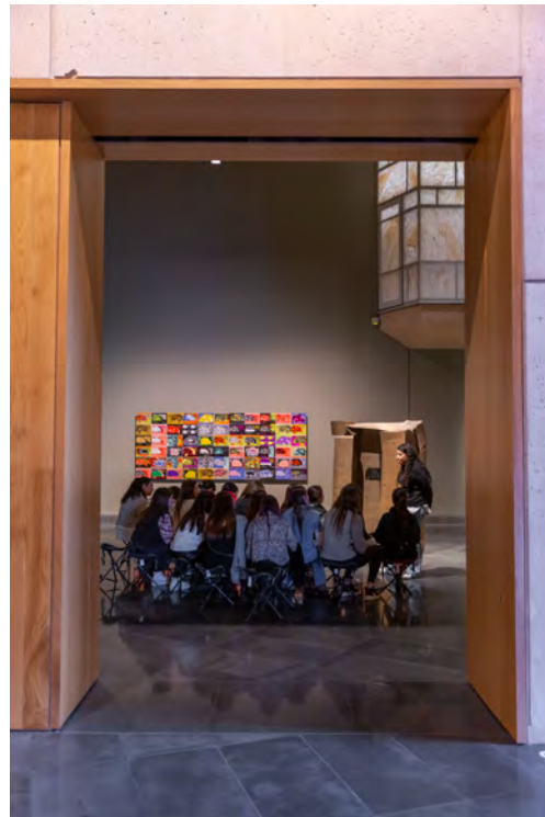
COMPOSICIÓ AMB CISTELLA. 1996 ANTONI TÀPIES

Les élèves sont introduits à l'activité avec pour objectif de mobiliser leur côté artistique. Les différentes expositions leur sont ainsi présentées,