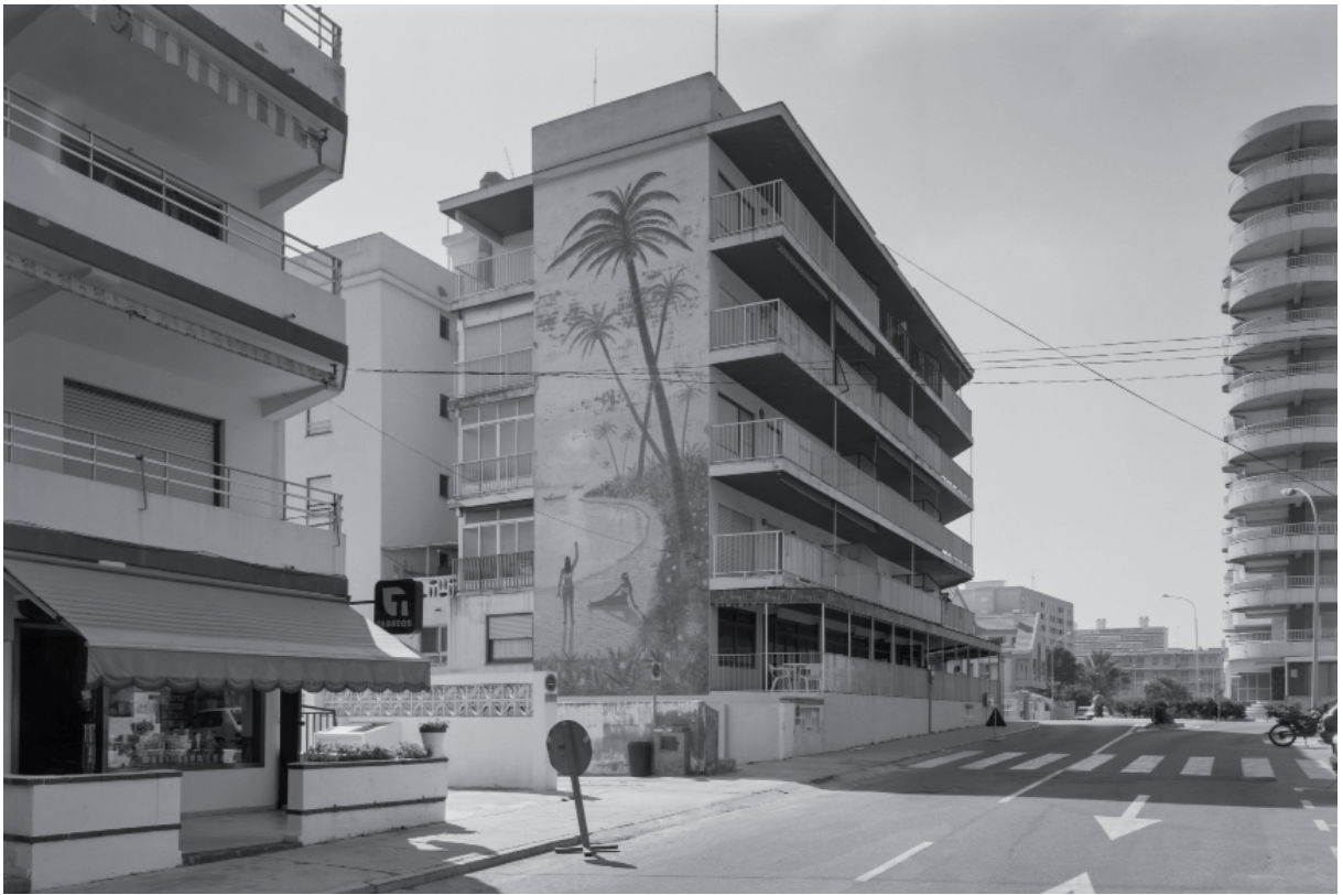
GANDÍA Y LA SAFOR 2. 1990 / ● MANOLO LAGUILLO - VEGAP - 2021