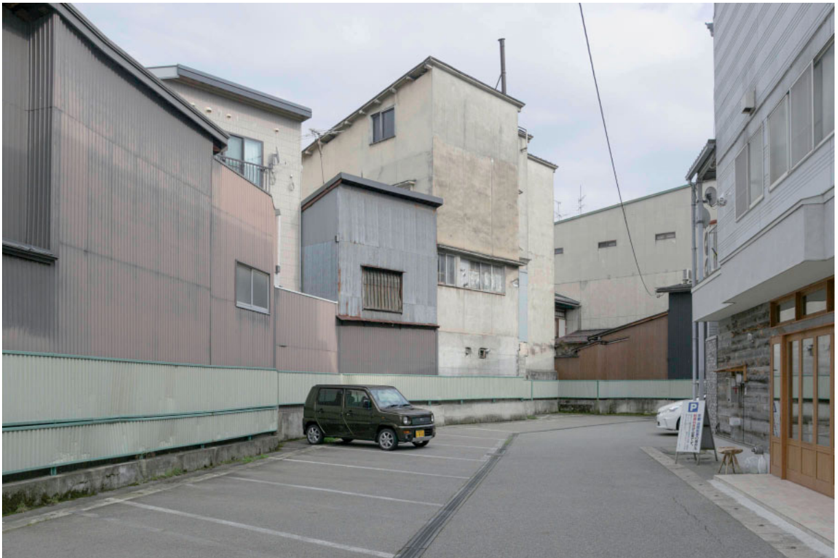
JAPÓN 02. 2014