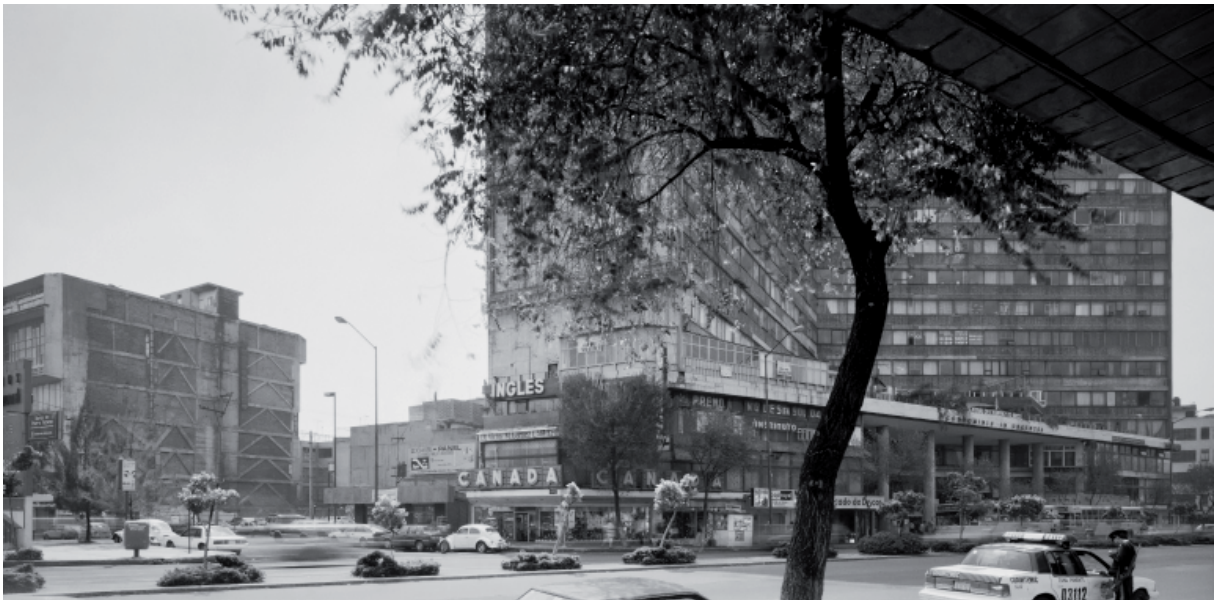
MÉXICO DF., EDIFICIO CANADÁ. 1992-1994