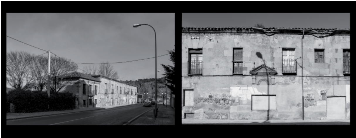
LAS PROVINCIAS. SORIA 07. 2014-2015