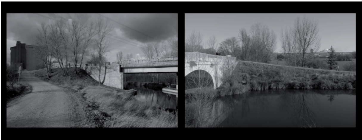
LAS PROVINCIAS. CIUDAD REAL 07 / LAS PROVINCIAS. PALENCIA 04. 2014-2015