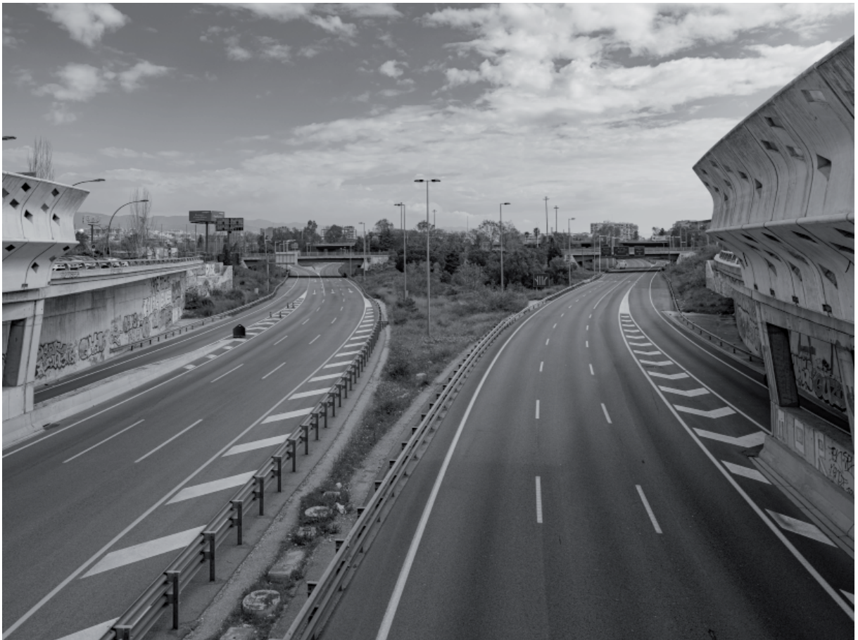
BARCELONA 09 ABRIL 2020 GRAN VIA B