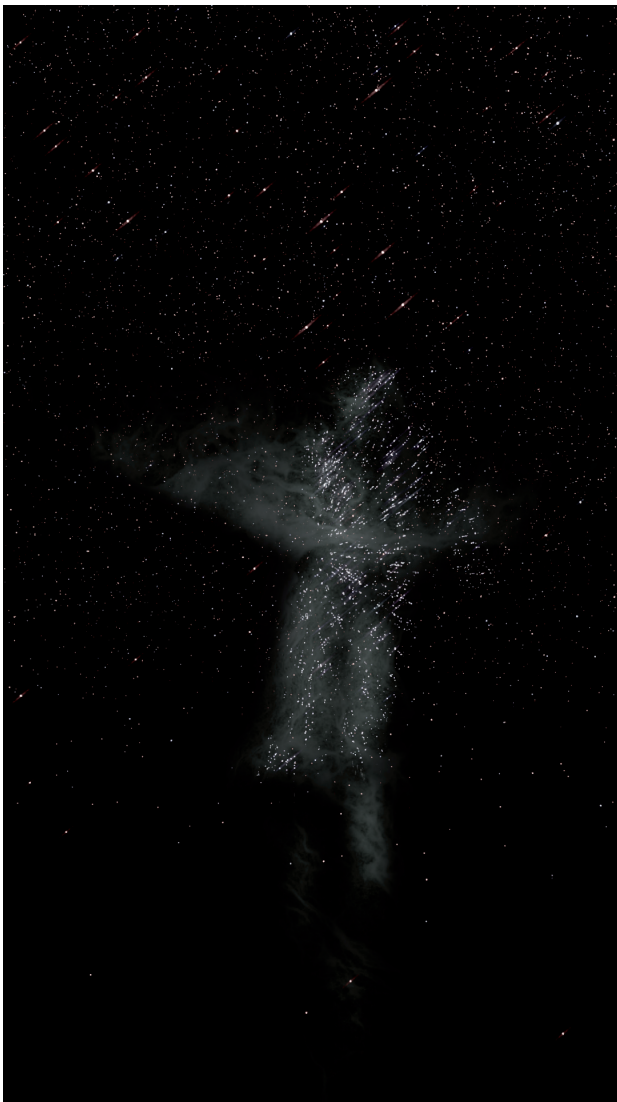
LA CAVERNA (DETALLE). 2022.