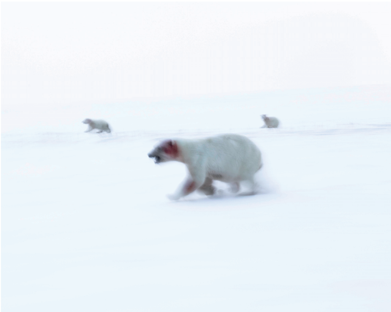
MAPAS DE LO INVISIBLE. 2022. CORTESÍA ÁLVARO LAIZ

las vivencias y experiencias previas a la existencia de un lenguaje oral o escrito, que se codificaba a través de una serie de ritos y ceremonias que marcaban la relación de los hombres entre si y también de estos con el cosmos, el tiempo y el espacio, explicados a través de la creación de los dioses y plasmados a través de los mitos. Estos rituales se basan en la repetición de gestos mágicos a través de los cuales alterar la realidad y conectar con lo divino, y generan una memoria corpórea. Todo ello lo recoge Laiz en La Caverna , representación escenificada de rituales chamánicos de tradición siberiana y americana, en la