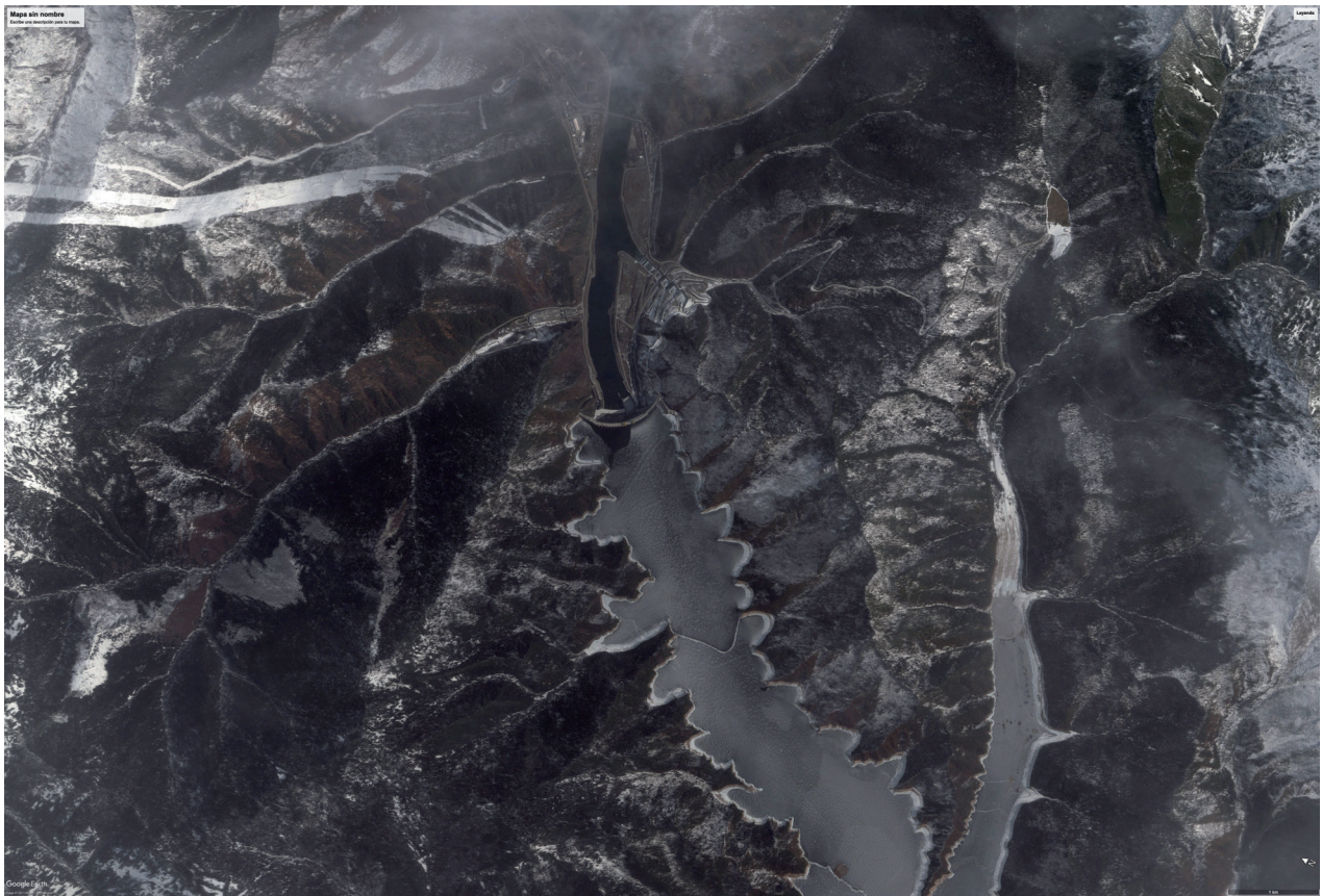
PRESA SAYANO SHUSHENSKAYA. SERIE POSTALES PARA MAÑANA. 2022. CORTESÍA ÁLVARO LAIZ

continente miles de años atrás. Al mismo tiempo, en estas imágenes desdibujadas se refleja cómo el tiempo y la memoria no siempre responden a una concepción lineal de la historia, ya que en ellas vemos como se interrelacionan pasado, presente y futuro.