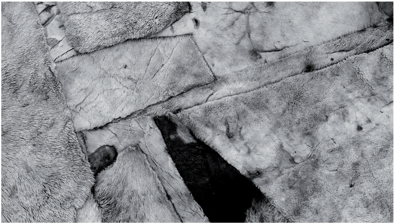
TÓTEM. 2022. CORTESÍA ÁLVARO LAIZ

destruccion del hombre con la naturaleza no fue siempre así, ya que en origen el hombre estaba estrechamente vinculada con esta, lo cual todavía hoy lo vemos en las culturas populares. Los pueblos nativos americanos todavía hoy comparten un sistema de creencias animistas fuertemente arraigadas al culto a la tierra, y esta vinculación es algo que heredaron de sus antepasados, pasando de generación en generación. Aunque hoy nos es imposible conocer qué sintieron los primeros humanos al recorrer la tierra, sí podemos saber que estos sentimientos, sus experiencias vitales y sus formas de pensar o sentir, estarían estrechamente ligados al entorno en el que desarrollaron sus vidas. El contacto físico con la naturaleza va marcando nuestro camino, tanto físico como espiritual, lo cual se recoge en Mapas de lo invisible , serie que nos invita a considerar nuestra relación con nuestro entorno más inmediato y nuestro pasado más remoto mediante la imagen en movimiento, a través de una serie de recorridos a pie, desde el Estrecho de Bering hasta Tierra de Fuego.