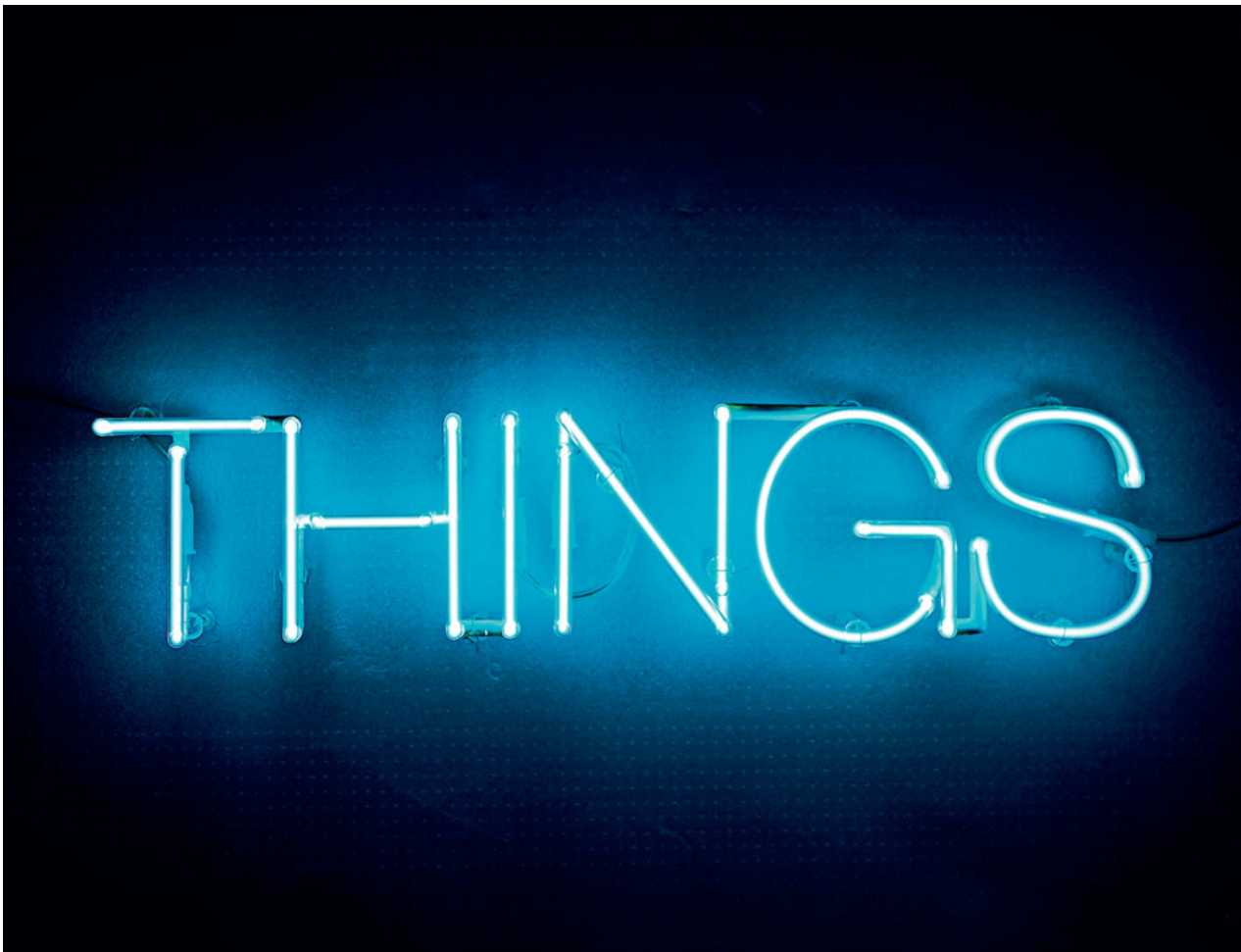
WORK NO. 251: THINGS (ED. 1/3), 2001. MARTIN CREED. © VEGAP, PAMPLONA 2023