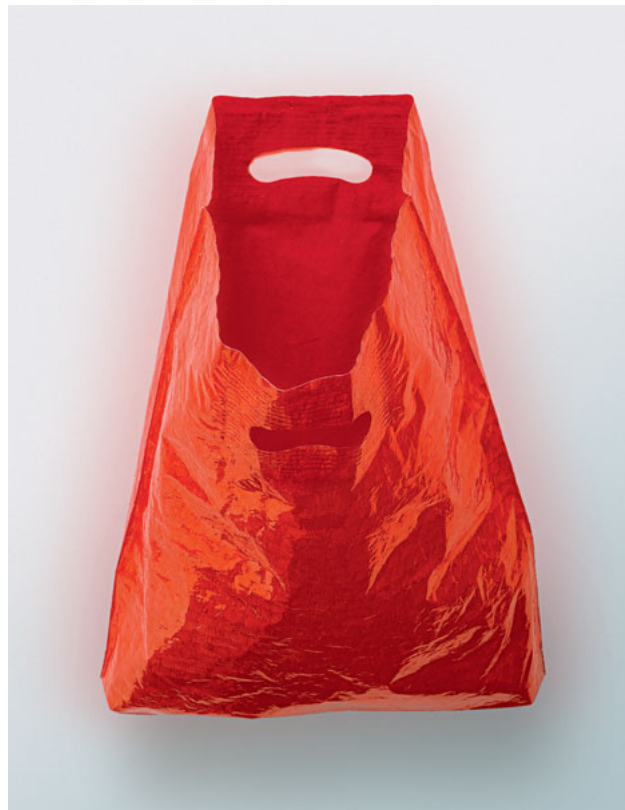
BAG DRAWING, 2000. © ANNA BARRIBALL. CORTESÍA DE LA ARTISTA Y DE FRITH STREET GALLERY, LONDRES

Finalmente, el video Sueño (muy cerca) , de Dora García, realiza “una alusión cómica y burlona al proceso creativo de «inspiración» y producción”. 5 A partir del lenguaje