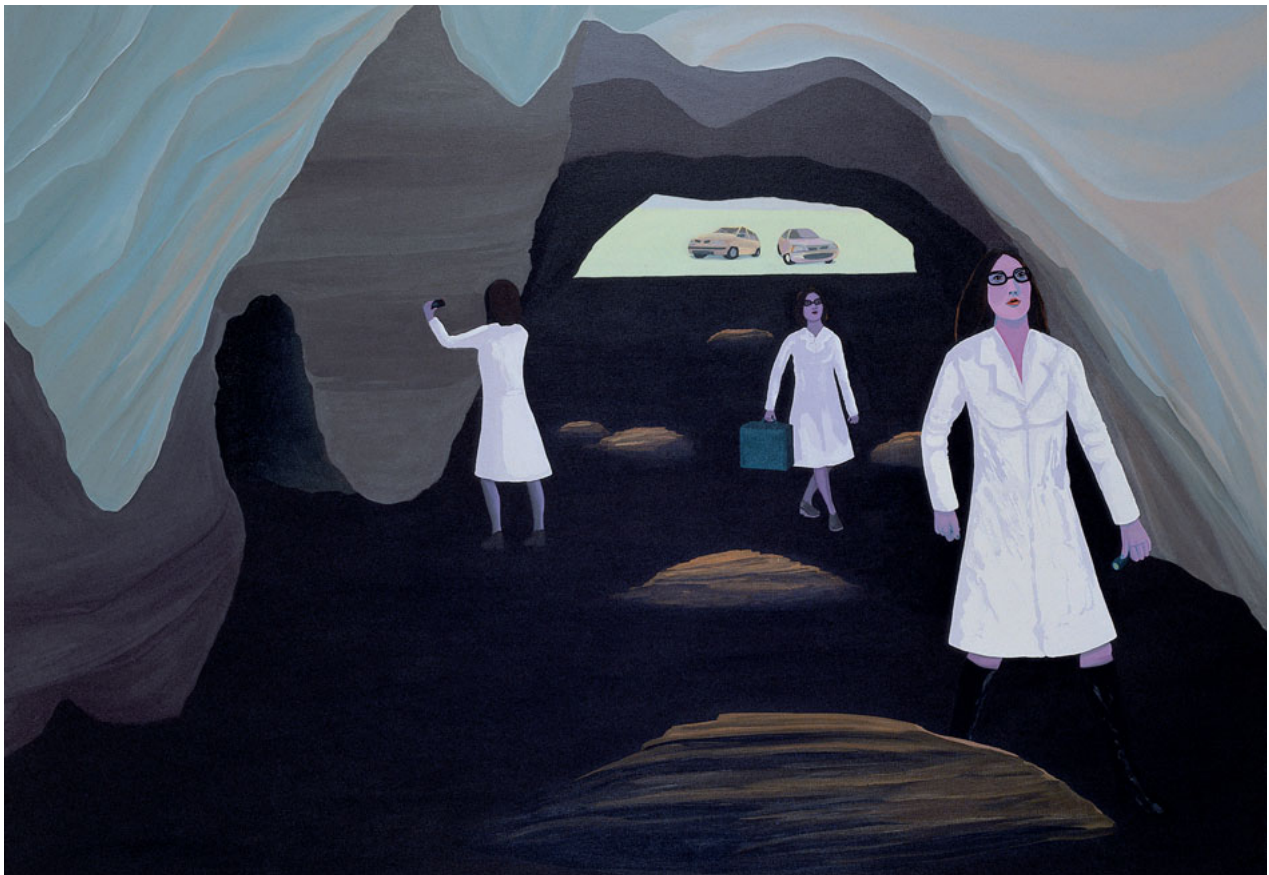
CAVE WOMAN, 2000. © LIZ ARNOLD.