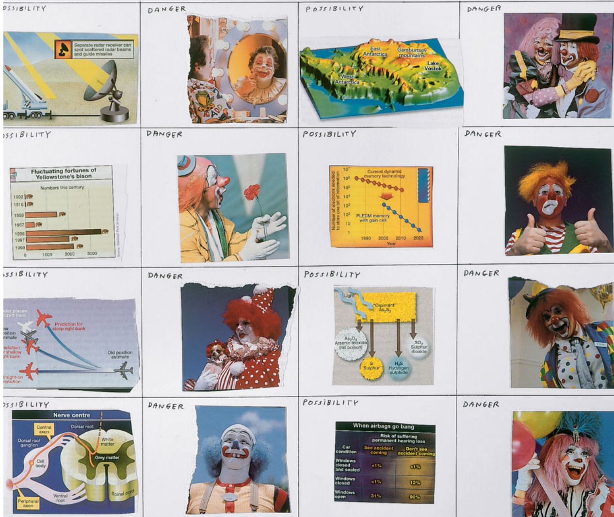
ALIVE TO THE POSSIBILITIES, 2001. DAVID SHRIGLEY. © VEGAP, PAMPLONA 2023

1.- ARE YOU ? 2.- AM I WHAT ? 1.- ARE YOU ALIVE TO THE POSSIBILITIES ? 2.- WHAT POSSIBILITIES ? 1.- I'LL ASSUME, THEN, THAT YOU ARE NOT . (PAUSE) 2.- BUT ARE YOU AWARE OF THE DANGERS ? 1.- WHAT DANGERS ? 2.- AH. JUST AS I THOUGHT. YOU ARE UNAWARE OF THE DANGERS.