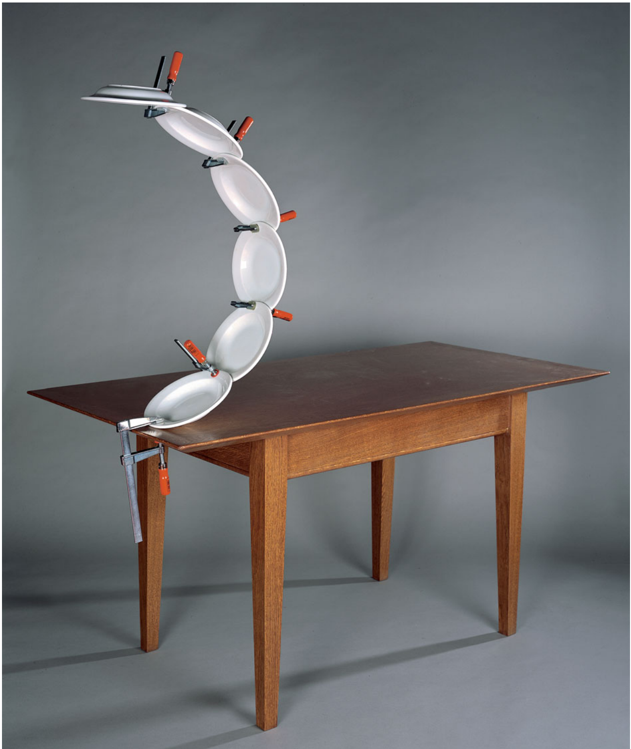
BAD MANNERS , 1998. © JAIME PITARCH.

pected relationships with everyday objects. Erwin Wurm's work is notably influenced by the ideas and interests of the 1970s Vienna Circle.