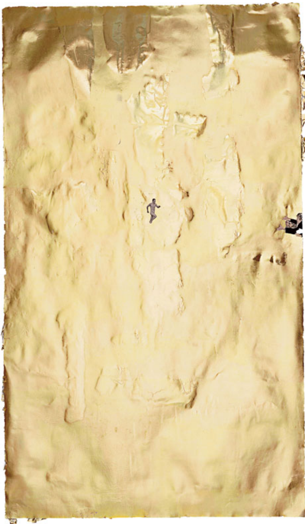
INTIMATE STRANGERS: POPE FANS REACHING TOWARD, 2000. © ANDREA BOWERS

el sistema educativo. Smith trabaja con el lenguaje, o más bien lo utiliza, lo subvierte, agrieta sus leyes para su beneficio. Desde la visualidad evidentemente lúdica, con los colores contrastantes y estridentes que emplea, realiza un juego ortográfico, donde decide no respetar las leyes y utiliza palabras mal escritas que transmiten el mismo concepto en su existencia fonética. Este artista comprende muy bien las posibilidades del humor y lo lúdico: no solo utiliza un seudónimo satírico, sino que, además, desde ese discurso del juego, ha desarrollado campañas por el desarrollo de habilidades creativas y artísticas en la educación.