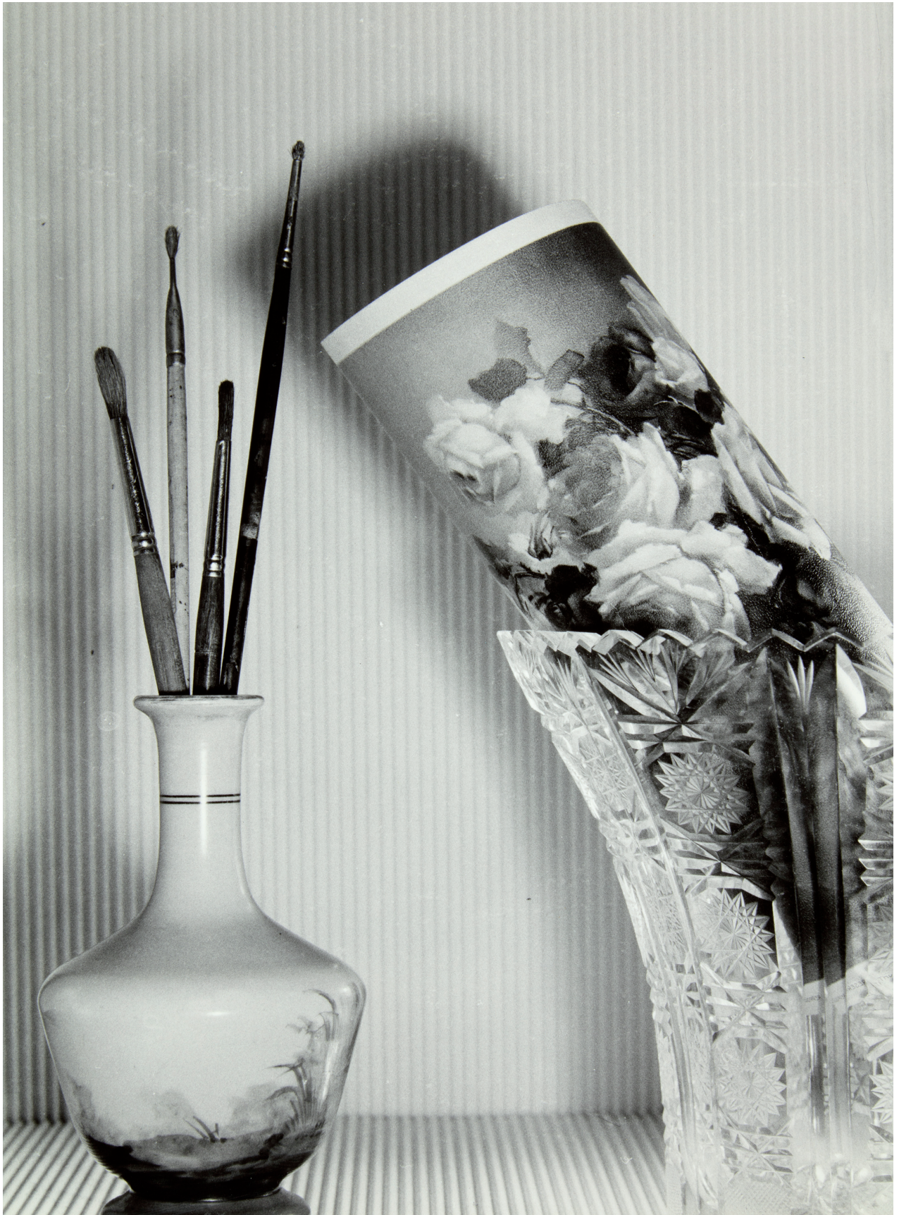
BODEGÓN DE LOS PINCELES, 1955. © JUAN DOLCET SANTOS