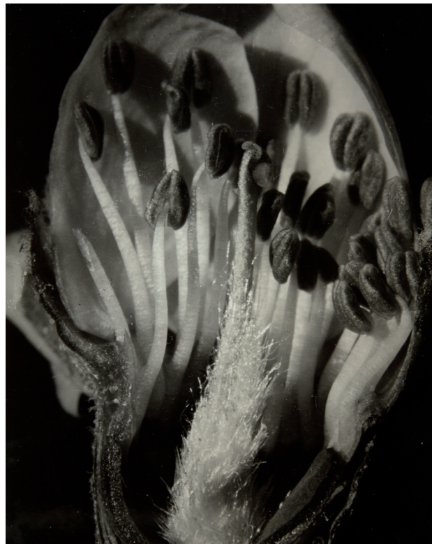
FLOR D'ATRUELLAR, TALL LONGITUDINAL, 1930. © EMILI GODÉS HURTADO

XX un tema de continua reflexión y debate. Distintos teóricos como Aby Warburg y Walter Benjamin advirtieron sobre el poder de las imágenes. Benjamin, uno de los pioneros en la teoría de la fotografía, alertó de que con los avances técnicos que permitían mejorar y acelerar los mecanismos de producción y reproducción de imágenes, su receptor se tornaba más ingenuo. Como percibió Susan Sontag en los años 70, la fotografía, por más documental o precisa que sea, siempre es un punto de vista situado, haya sido construido de manera más o menos consciente. En cualquier caso, conviene también tener en cuenta la relación de las fotografías con la realidad. Como expresa Fernando Inciarte, toda obra de arte, incluso una fotografía que se construye con una intención artística, también tiene un elemento de “documento de la realidad” en tanto que siempre se refiere de alguna manera a ella.