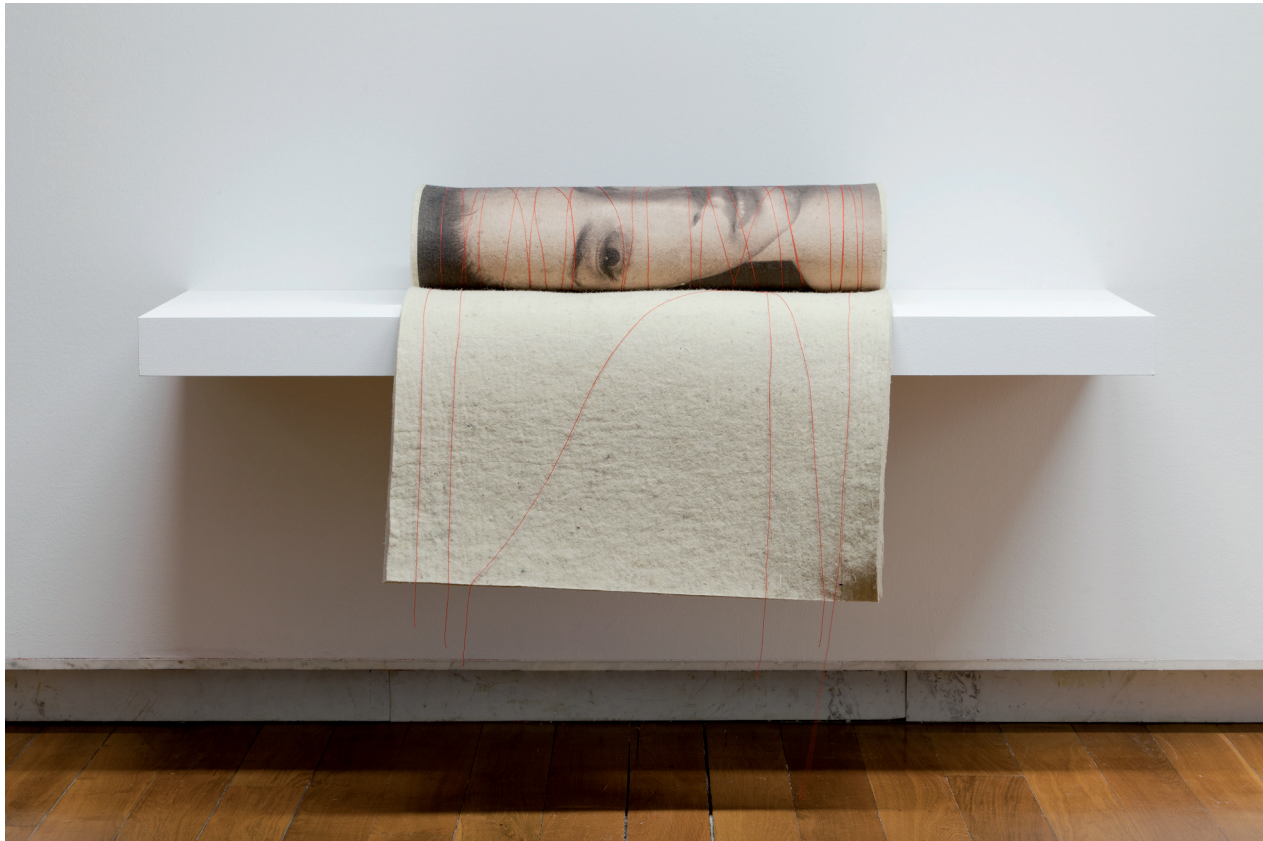
MÖBIUS, 2014. © LUIS GONZÁLEZ PALMA