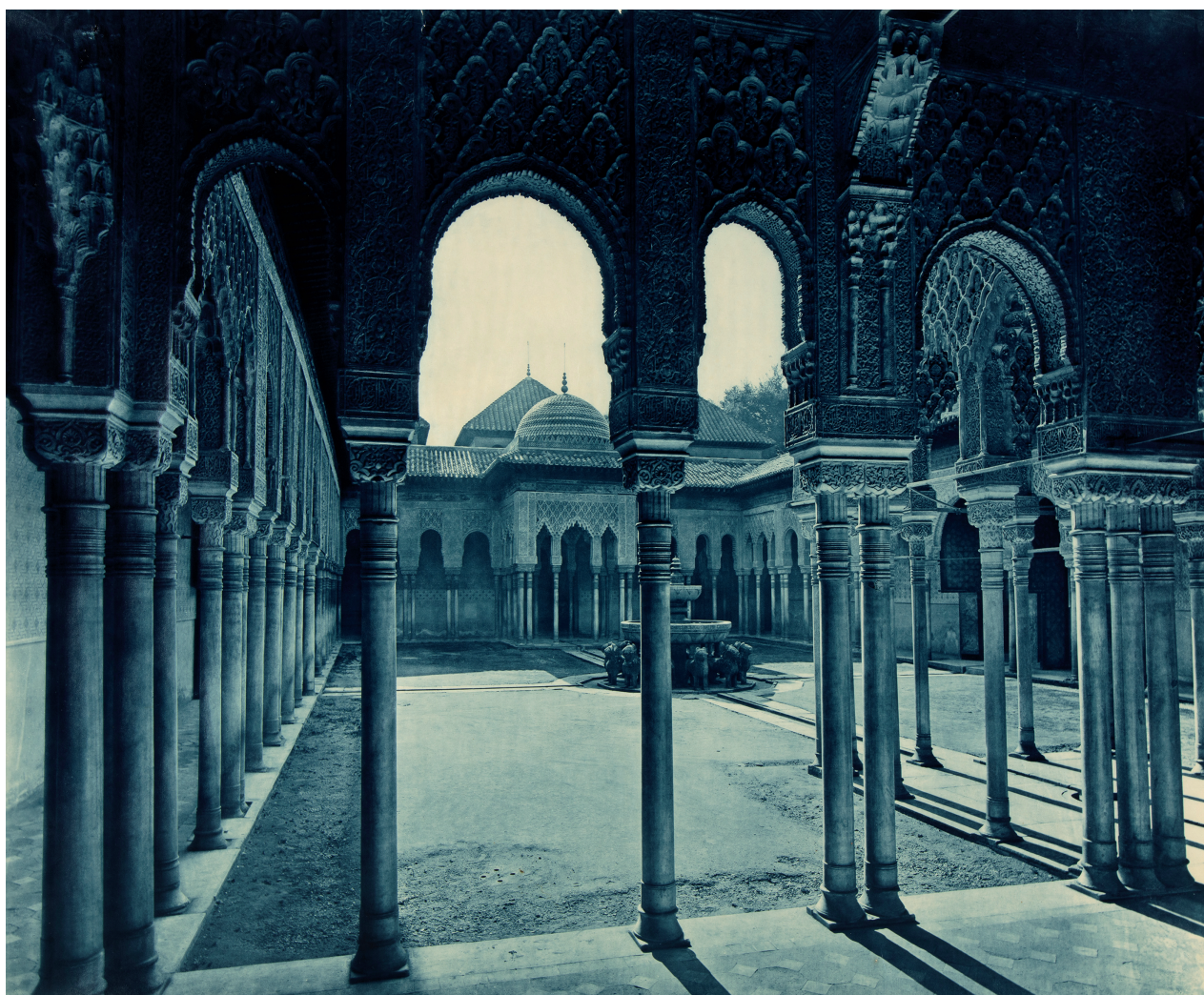
ALHAMBRA. PATIO Y FUENTE DE LOS LEONES, 1880.

special case for thinking about the many different ways it has been photographed.