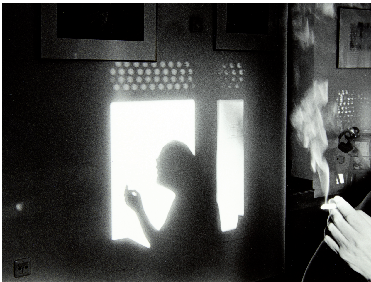
PLAZA SANTA BÁRBARA, S. XX.

¿Qué tipo de acceso a la realidad constituye hoy la imagen fotográfica? De la inquietud por encontrar una respuesta a esta pregunta surge la exposición Constelaciones posibles . La imagen como fragmento de la realidad en la Colección MUN.