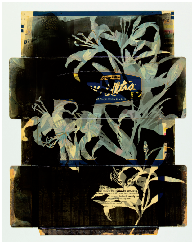
KLEENEX ULTRA II, 1992. © JOAN FONTCUBERTA