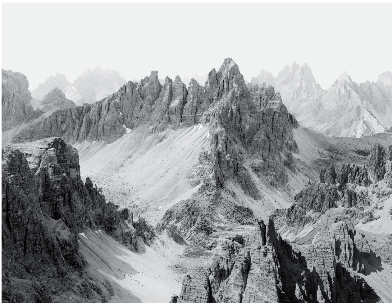
MONTE PATTERNO, 2014.

Universidad de Navarra, which consists of nearly 23,000 photographs and almost 250,000 negatives.